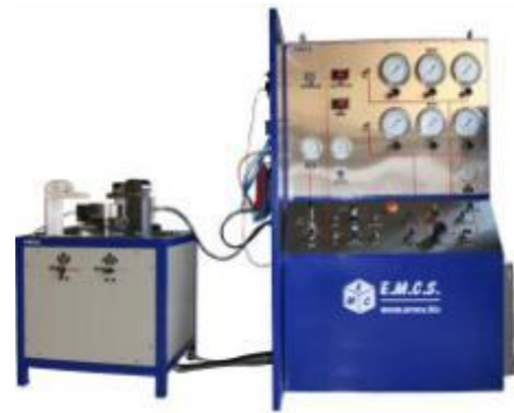
BANC TARAGE STATIQUE