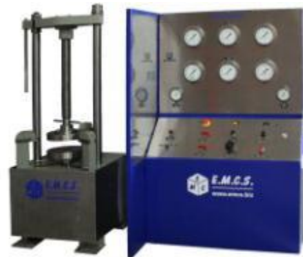
BANC D'EPREUVE VANNES