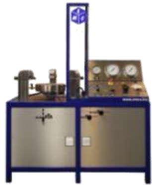
BANC TARAGE TRANSPORTABLE

(Etudes, conception suivant vos besoins... DN, Pression, fluide de test)